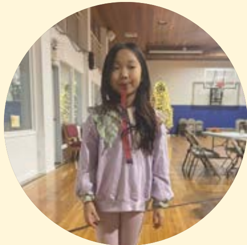
조 새 봄 학생